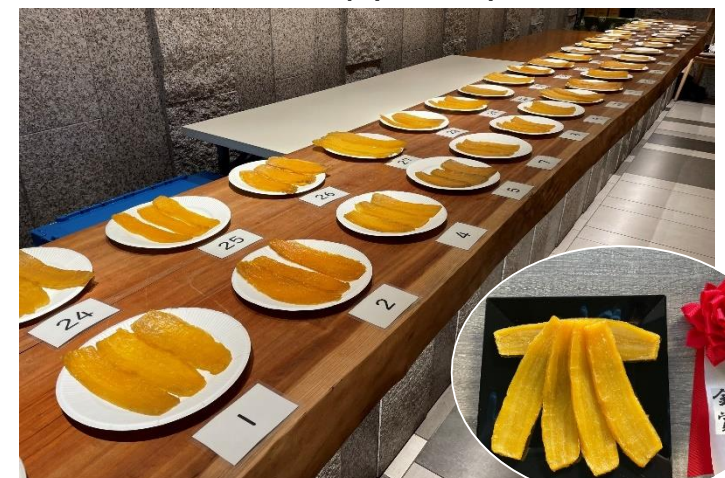
＜昨年度品評会の様子＞