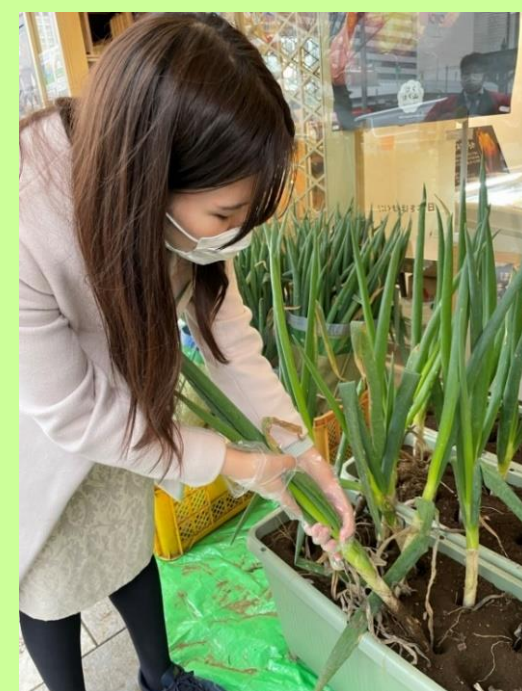
<昨年度ねぎ収穫体験の様子>

イベントで対象商品をご購入いただいた方を対象に、店舗の外の特設エリアにて、ねぎ収穫体験を実施します。プランターに植えてあるねぎを引っっこ抜き、泥のついた皮をむいて出荷できる状態にするところまでを体験でき、 収穫したねぎは無料でお持ち帰りいただけます。 貴重な農業体験をぜひお楽しみください。