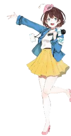
茨城県公認Vtuber 茨ひより