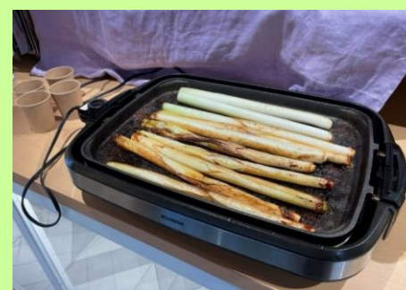
<昨年度ねぎ調理の様子>

イベント期間中は店内で下妻ねぎの試食と販売を実施いたします。試食として、ねぎの白身を真っ黒になるまで焼き、その皮をむいて中身を食べる スペインの郷土料理「カルソツツ」 風に調理して店頭でご提供。下妻ねぎの特長である甘みを存分に味わっていただけます。